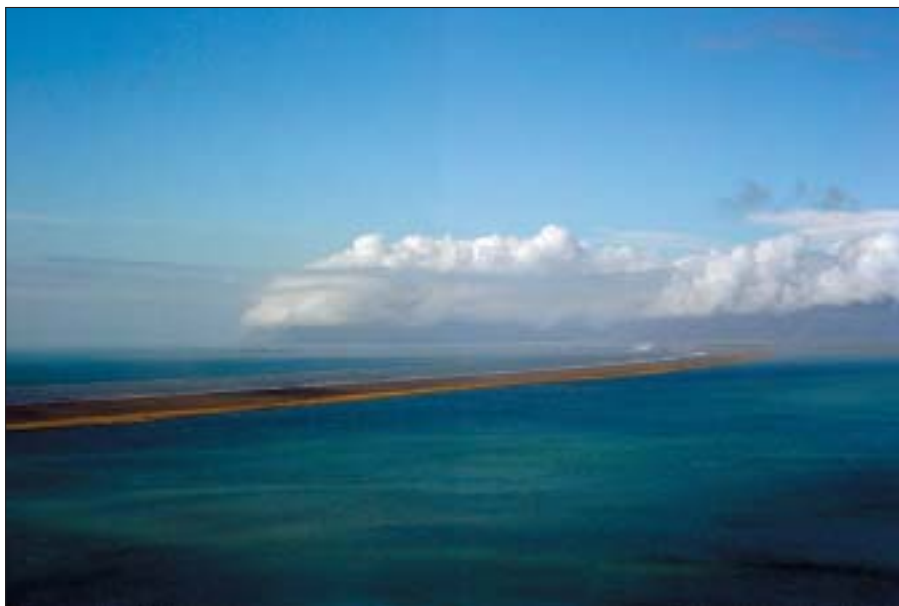
Billede af kysten af det sydlige Island ved Lónsvík. Havet (tv. i baggrunden) har samlet det sorte sand af vulkansk oprindelse til en barriere foran kysten. I den associerede lagune (th. i forgrunden) nyder fugle beskyttelsen fra Nordatlantens bølger. Feltarbejde fra tellejr var særligt godt i år pga. den fine islandske sommer i 2003.

Studenter og forskere fra Aalborg og Aarhus Universitet er lige vendt hjem fra feltarbejde i Island, hvor formålet blandt andet har været at indsamle prøver, som skal analyseres for ædle metaller såsom guld, platin og palladium. Prøverne er taget fra de forstenede hjerter af ca. 6 mio. år gamle islandske vulkaner, som kun er blottede få steder på den nordatlantiske ø. Prøveindsamlingen i år er foregået ved foden af Europas største gletscher Vatnajökull i det sydøstlige Island. Forskningsprojektet vil ud fra indholdet af ædle metaller i prøverne vurdere potentialet for naturgivne økonomiske ædelmetalforekomster i Island samt bidrage med ny indsigt i metallogenese i vulkanske komplekser generelt.