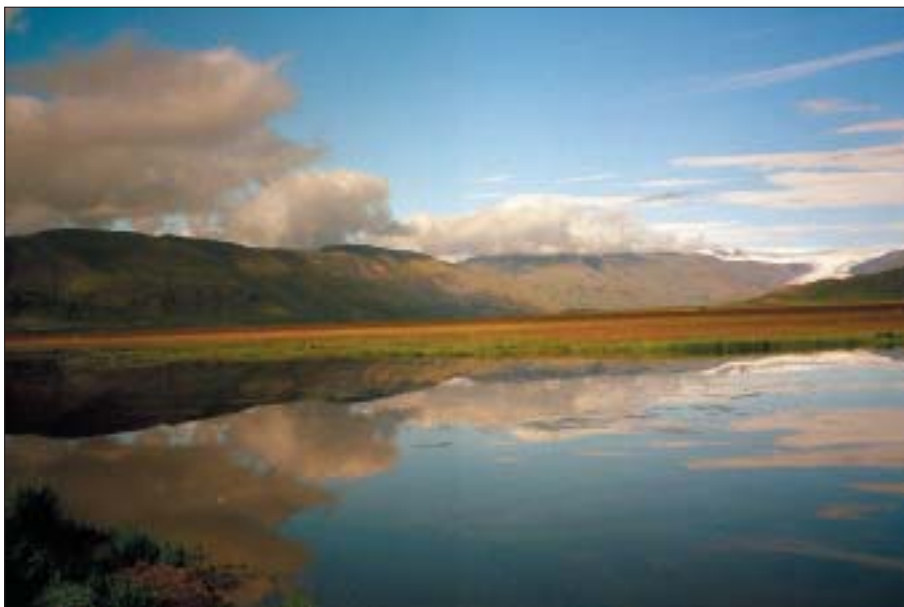
Det er denne smukke islandske natur, der tiltrækker flere og flere turister, som er vigtige i den islandske økonomi; fjeldene undersøges for ædelmetalforekomster.

Men svovl kan også frigives, før lavaen når jordoverfladen flere km under jordoverfladen i hjertet af vulkanen – i vulkanens magmakammer (magma = smeltet stenmasse som potentielt kan størkne på stor dybde; lava er magma, der er kommet ud af en vulkan). I dette magmakammer afkøles og udkrystalliseres basalten, og herved nedsættes basaltens evne til at op-