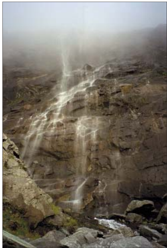
Indsamling af prøver på de højeste lokaliteter bringer én op til skyernes underkant. På billeder skjuler vandfaldets øvre del sig i skyens skorter.

og hvor vulkansk materiale vælder op og danner ny jordskorpe. Oceanbundsspredning er i dag aktiv langs en vulkansk højderyg, der strækker sig fra syd til nord midt i Atlanterhavet. Det specielle ved spredningsryggen ved Island er, at den her ligger over et ekstraordinært varmt område af jor-